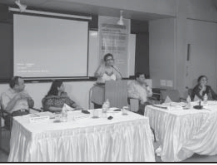
તા.૮.૭.૨૦૧૧ના રોજ અમદાવાદ ખાતે યોજાયેલી વિમર્શ સભા

અને દરેક જગ્યાએ નિસરણીમાં બંને બાજુ કઠેડા મૂકવામાં આવ્યા છે. રિકાઈનરી અને અન્ય જગ્યાઓની આ બાબતો મુશ્કેલ બની છે ત્યારે કંપનીએ તેલ ઉદ્યોગનાં સુરક્ષાનાં ધોરણોનું પાલન કરવાની જરૂર છે. કોઈક કટોકટીની પરિસ્થિતિ ઊભી થાય ત્યારે વિકલાંગતા ધરાવતી વ્યક્તિઓને ખસેડવા માટે તમામ સલામતી કર્મચારીઓને તાલીમ આપવામાં આવી છે. અવારનવાર સુરક્ષા માટે સૂચનાઓ આપવામાં આવે છે અને અખતરાઓ કરવામાં આવે છે.