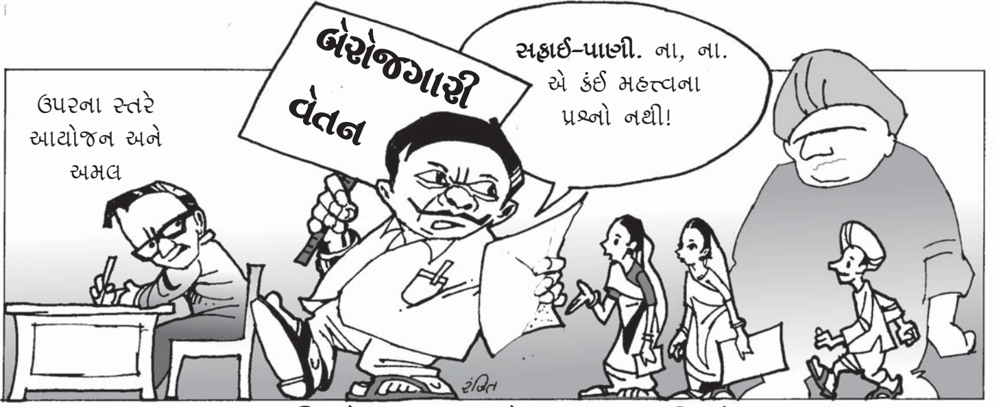
સંગઠિત ક્ષેત્રનાં મજૂર મંડળો