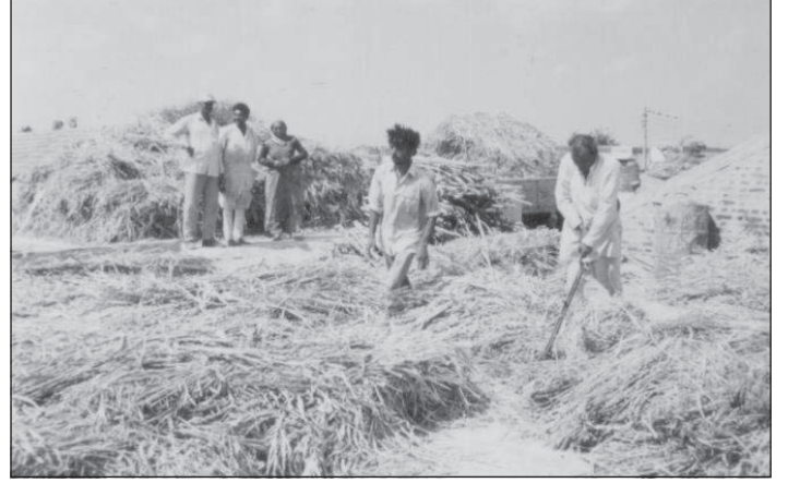
ભાવનગર જિલ્લાના ડેડકડી ગામ (વોટરશેડ)માં ઘાસચારાની સમસ્યા ન હતી. વધારાના ઘાસચારાનું વેચાણ પણ થયું.

૧૯૯૫માં ગુજરાતમાં ૧૩૦૦ ગામોમાં ૧૧૦ સંસ્થાઓ દ્વારા જે વોટરશેડનું કામ શરૂ થયું તે ૨૦૦૦ની સાલમાં પૂરું થવા આવ્યું. દરમિયાનમાં દર વર્ષે વધારે ગામોમાં વોટરશેડ યોજનાનો અમલ શરૂ થતો રહ્યો છે.