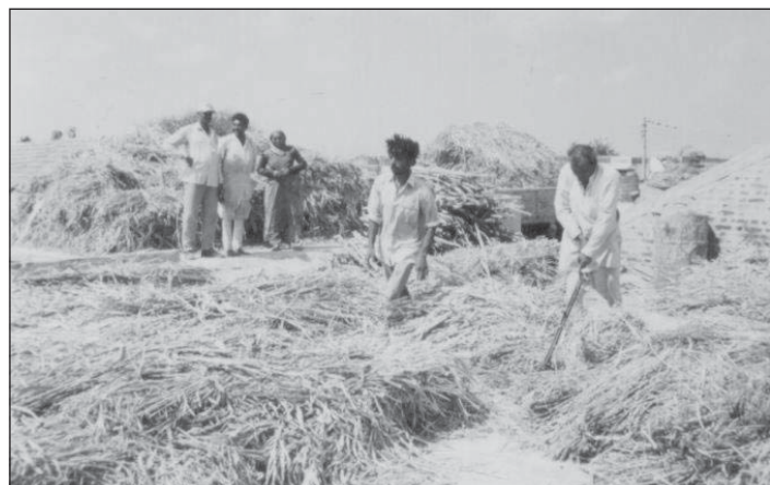
भावनगर जिले के डेडकड़ी गाँव में (वाटरशेड) घासचारे की समस्या न थी। अतिरिक्त घासचारे को बेचा भी गया।

जा सके। संचालक संस्था का काम लोगों को तैयार करना, संगठित करना, शिक्षित करना और यह देखना कि ग्राम स्तर पर योजना का ठीक-ठाक क्रियान्वयन हो।